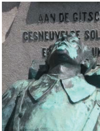
HO_R18.JPG en GI_R08.JPG

Vergelijk de uitdrukking op het gezicht van beide soldaten. Als je een tekstballonnetje erbij zou moeten zetten, welke gedachte zou de ene hebben, en de andere?