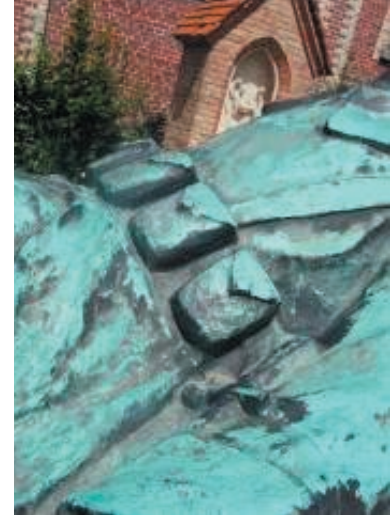
GI_R13.JPG en GI_R12.JPG en GI_R14.JPG