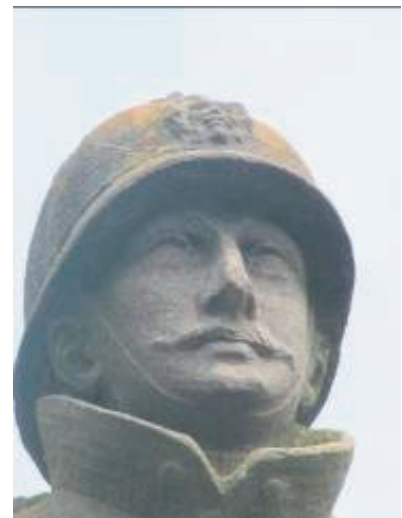
GI_R15.JPG en HO_R19.JPG en HO_R18.JPG

Herken je voorwerpen? Waarom zou de beeldhouwer die details willen erbij plaatsen? Welke voorwerpen zou jij afbeelden als je een visser zou moeten beeldhouwen of tekenen? Of een onderwijzeres?