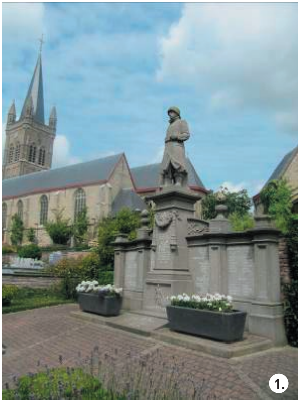
HO_R12.JPG en GI_R05.JPG

Hieronder zie je enkele foto's van het oorlogsmonument van Hooglede en dat van Gits . Bekijk ze aandachtig en probeer enkele vragen te beantwoorden.